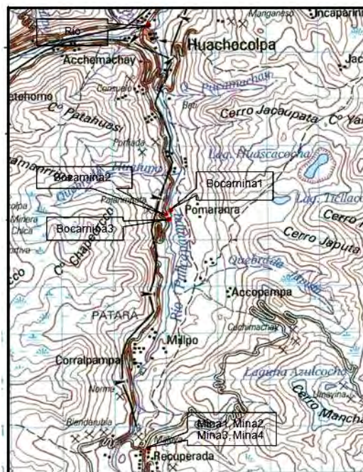
Figura 1. Ubicación de puntos de muestreo.

efectuados por la técnica de Espectrometría Laser, en los Laboratorios de Hidrología Isotópica del Centro Nuclear de Huarangal, en Lima.