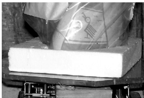
Figura 2. Dispositivo rotatorio de irradiación. Se muestra una parte del objeto cerámico en estudio.

El sentido del dispositivo, cuyo diseño se efectuó para este trabajo, es asegurar que en condiciones de operación rutinaria, muestra y estándar reciban el mismo flujo integrado.